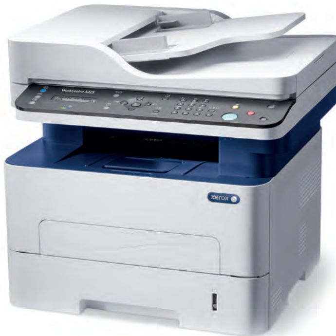
WorkCentre 3225. Kopieren. Drucken. Scannen. Faxen. E-Mail.