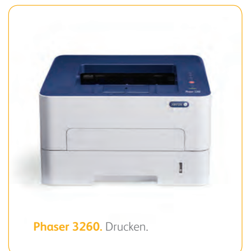
Phaser 3260. Drucken.